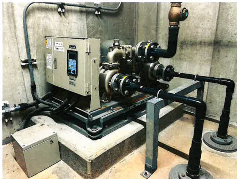
給水加圧ポンプ取替業務