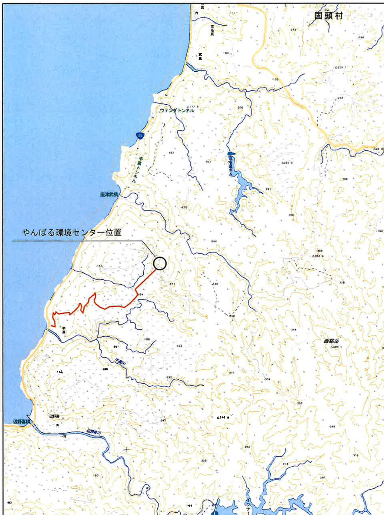
やんばる環境センター周辺拡大図