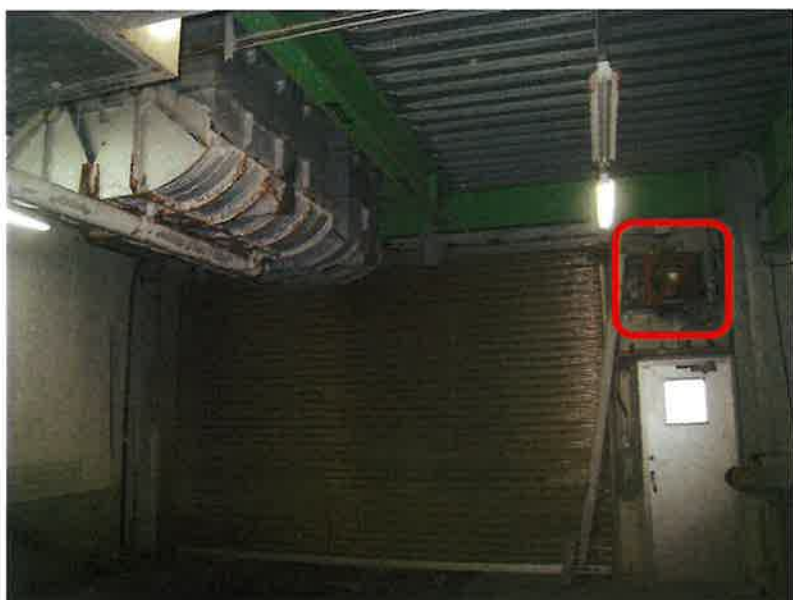
環境センター灰バンカー室 排気ファン

有圧換気扇用風圧式ステンレス製シャッター 有圧換気扇低騒音ステンレスタイプ三相排気型