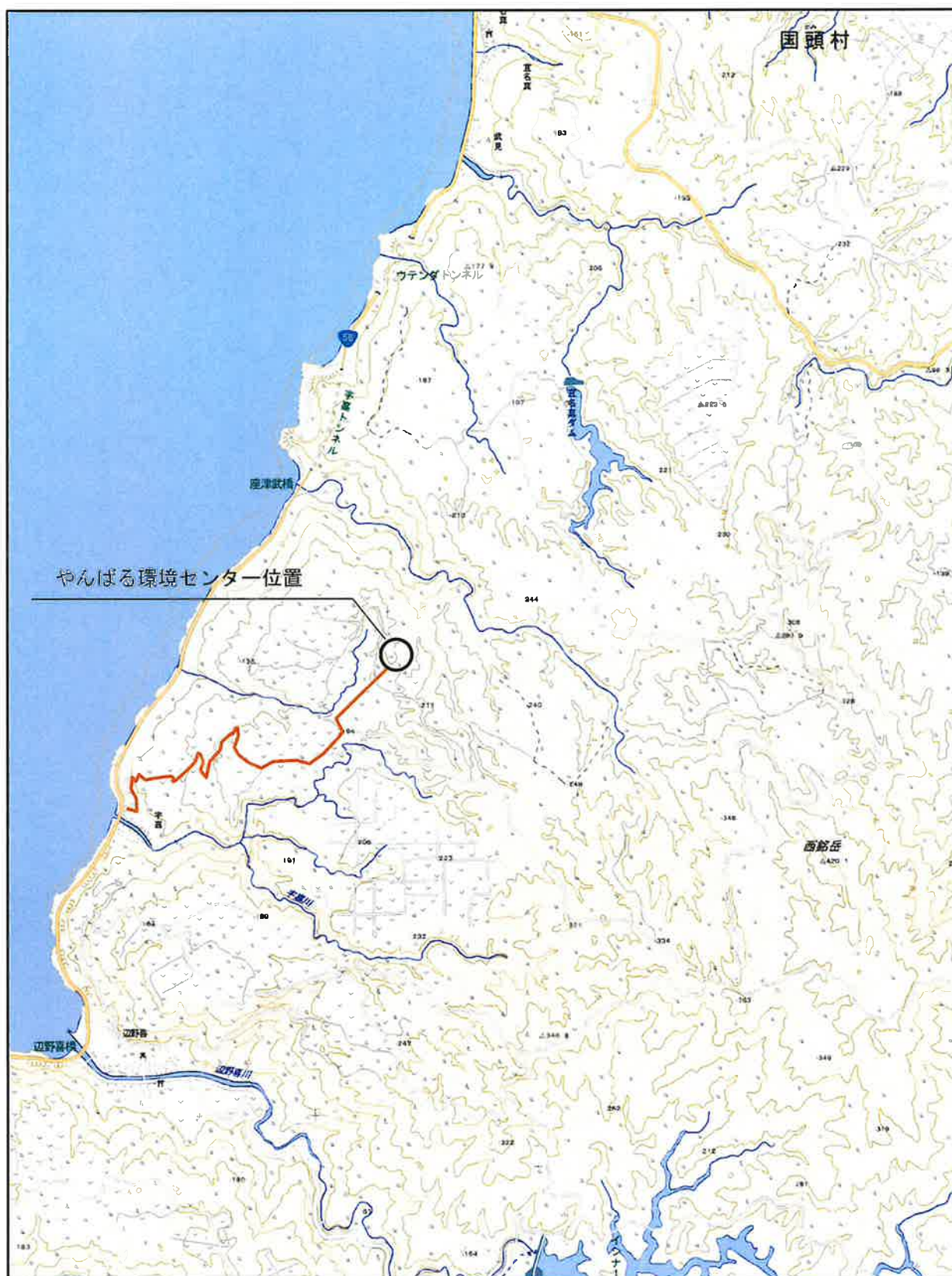
やんばる環境センター周辺拡大図