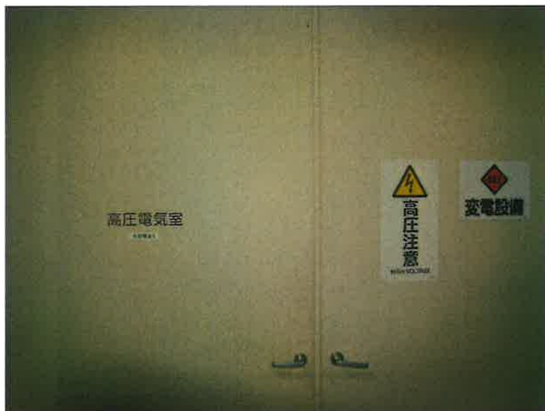
環境センター電気室