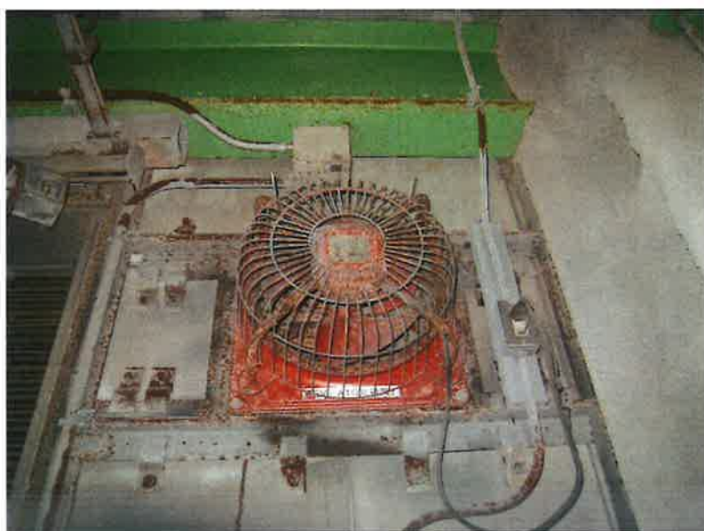
環境センター電気室 排気ファン