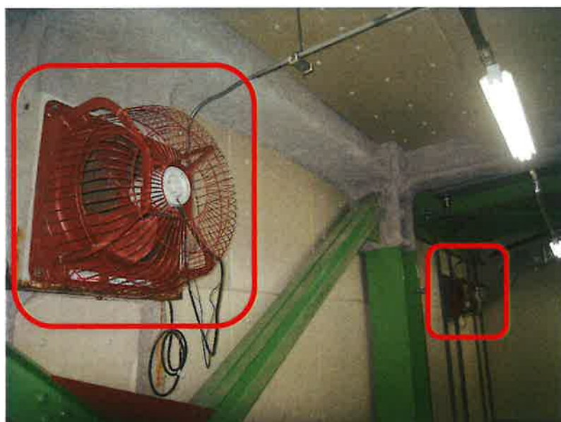
環境センター電気室 給気ファン・排気ファン