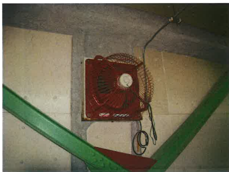
環境センター電気室 給気ファン

SUS製フィルターユニット防じん用 有圧換気扇用電動式ステンレス製シャッター 有圧換気扇低騒音ステンレスタイプ三相給気型