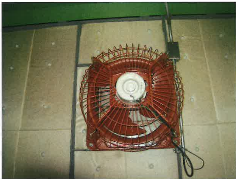
環境センター電気室 排気ファン

有圧換気扇用風圧式ステンレス製シャッター 有圧換気扇低騒音ステンレスタイプ三相排気型