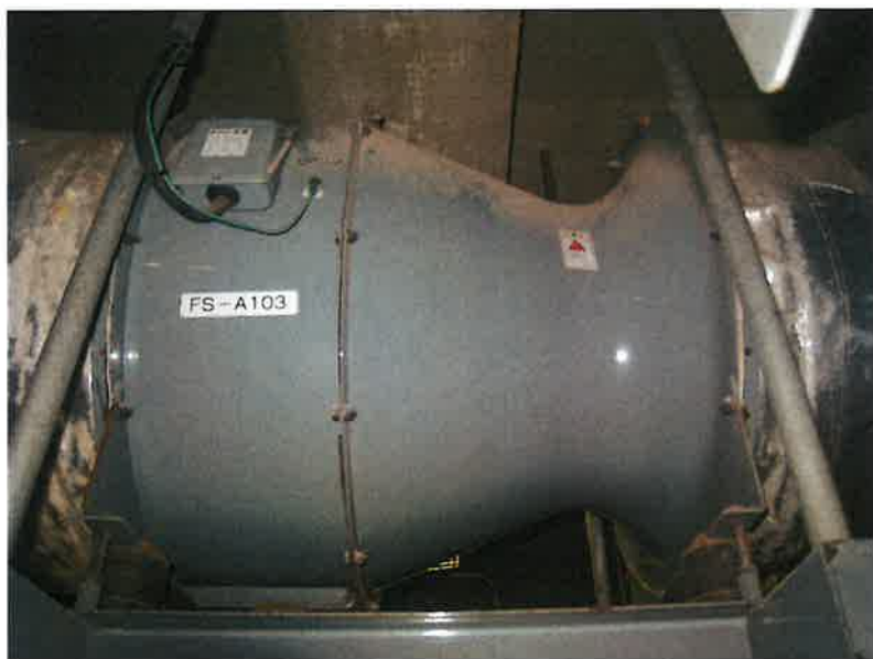
環境センター施設内 給気ファン