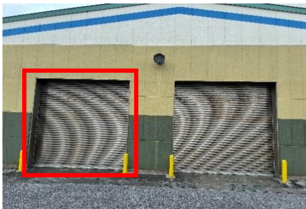
○リサイクルセンター（東面3）