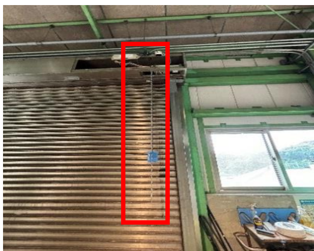
2.チェーンホイール・ガイド・チェーン （1組）