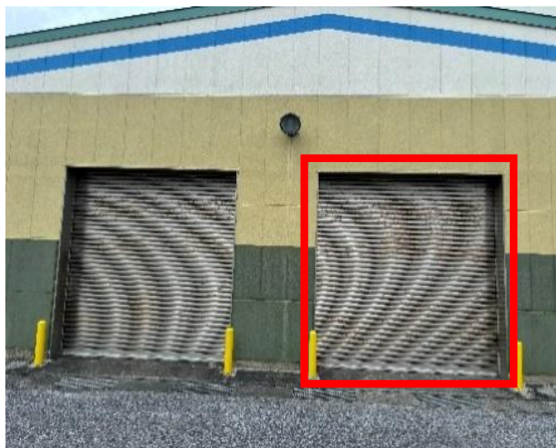
○リサイクルセンター（東面2）