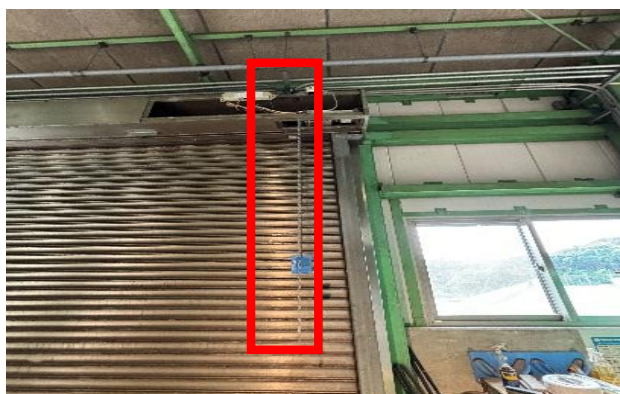
3.チェーンホイール・ガイド・チェーン （1組）